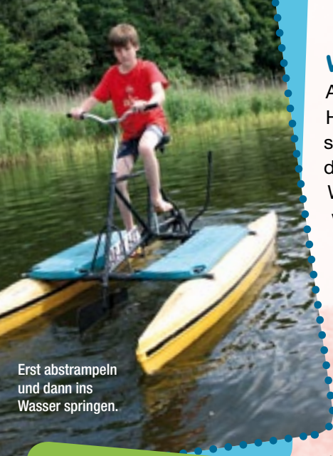
Erst abstrampeln und dann ins Wasser springen.