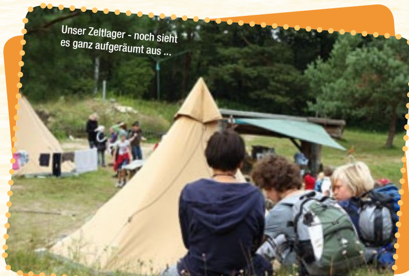
Unser Zeltlager - noch sieht es ganz aufgeräumt aus ...

Das Besondere: 230 wunderschöne Seen gibt es da, in denen man richtig klasse baden kann! Geheimnisvolle Moore und Wälder und jede Menge seltener Tier- und Pflanzenarten, die anderswo ausgestorben oder massiv bedroht sind: Orchideen und Wollgras und natürlich Biber, Fischotter, Fledermäuse, Eisvögel, Moorfrösche, Seeadler, Fischadler, und, und, und. Wusstest du, dass der Fischadler das Wappentier der Uckermark ist?