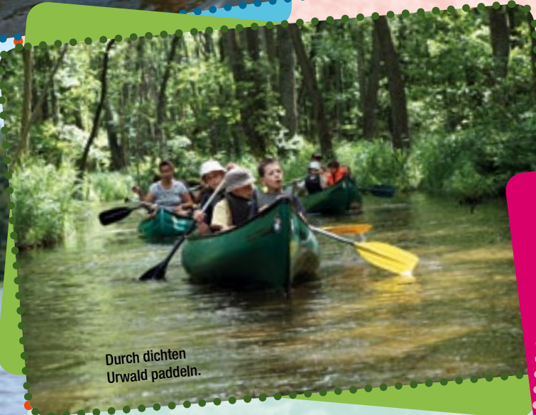
Durch dichten Urwald paddeln.

mit seinen scharfen Zähnen einen Baum gefällt, der nun quer über dem Bach lag. Wie angespitzte Bleistifte sahen Stumpf und Stiel des Baumes aus. Vermutlich will der Nager hier einen Staudamm bauen und für seine Familie einen kleinen See anlegen.