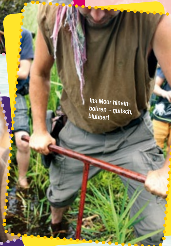
Ins Moor hineinbohren – quitsch, blubber!